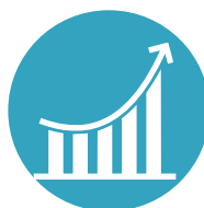
Izvještavanje o korištenju