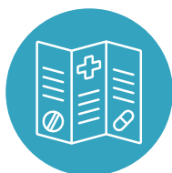
Informiranje i podizanje svijesti